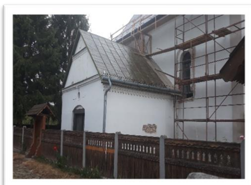
Tarpa Református Templom

Képek a terveknek megfelelő ütemezés szerint haladó beruházási folyamatról.