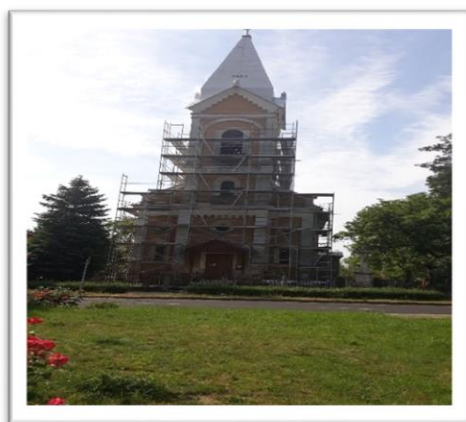
Mátészalka Római Katolikus Templom felújítása