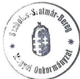
SESZTÁK OSZKÁR a közgyűlés elnöke