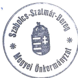
KEREKES MIKLÓS a bizottság elnöke